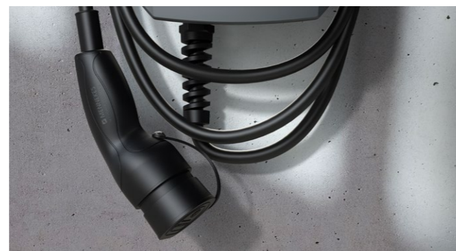
Sempre a portata di mano: cavo di ricarica di tipo 2 da 7,5 m