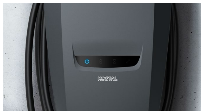
Sempre tutto sott'occhio: Display LED